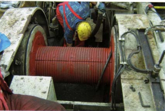
Runderneuert mit Lebus-Halbschalen