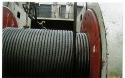
Perfekte Seilspulung nach Erneuerung